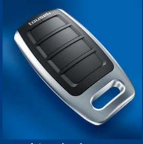
tousek Impulsgeberprogramm kompatibel und sicher