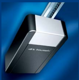
tousek Garagentorantriebe sparsam und schnell